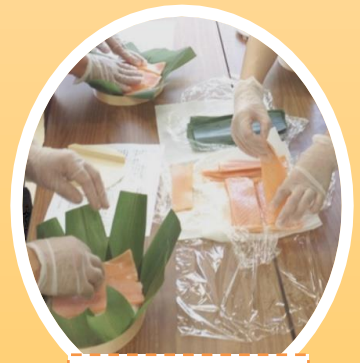
簡単ますのすし作り