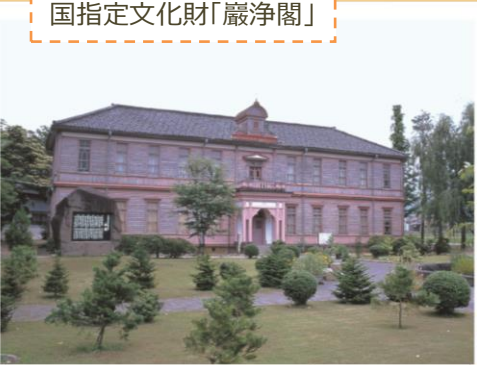
国指定文化財「巖浄閣」