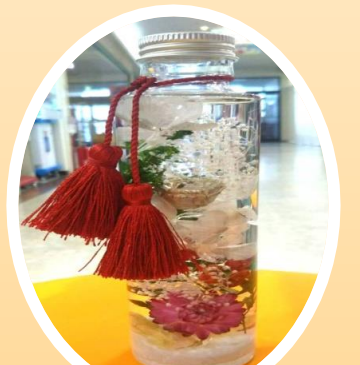
小菊のハーバリウム製作