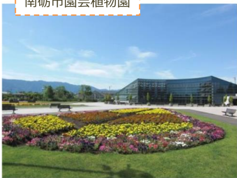
南砺市園芸植物園