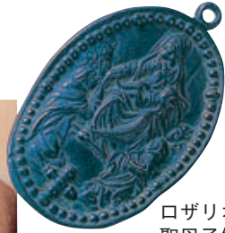
口ザリオ 聖母子像