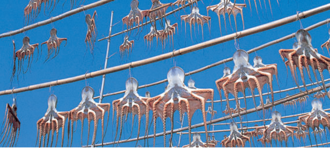
有明の風物詩・干しダコ