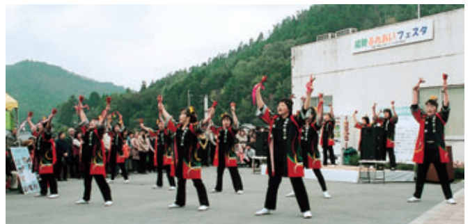
商工会女性部の「ヨサコイソーラン」(能勢ふれあいフェスタ)