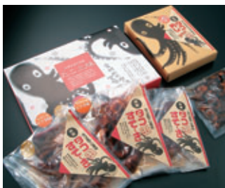
タコすてーき、タコめしgoo