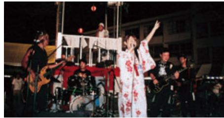
青年部のイベント