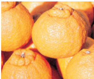
人気商品デコポン