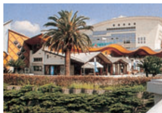
道の駅・リップランド