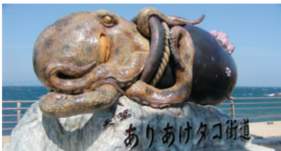
タコ街道のモニュメント