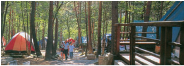
能勢グリーンランド