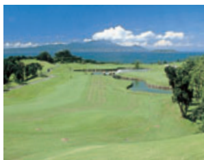
ザ・マスターズ天草