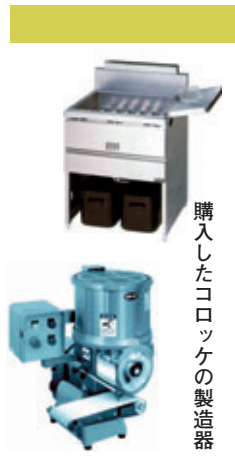
購入したコロッケの製造器

商業活性化プロジェクトとして、オリジナルコロッケ「龍ヶ崎まいんコロッケ」を考案し、食による街おこしに取り組んでいる。龍ヶ崎まいんコロッケを中心とした「まいんバザール」（龍ヶ崎市商工会主催）の開催は五七回を数え、市のイメージアップ、PRにつながっている。